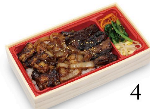
A4黒毛和牛 熟成肉 カルビホルモン重 100g 2,180円 150g 2,780円