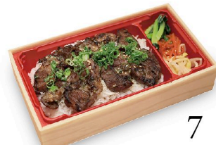
和牛 ネギタン重 100g 2,380円 150g 3,080円