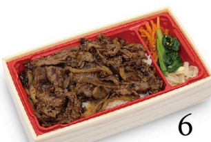
A4黒毛和牛 熟成肉 すき焼き重 100g 1,980円 150g 2,580円