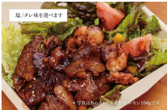
*写真はBのカルビ&新鮮ホルモン150gです