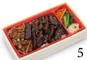
A4黒毛和牛 熟成肉 カルビ重 100g 2,280円 150g 2,980円