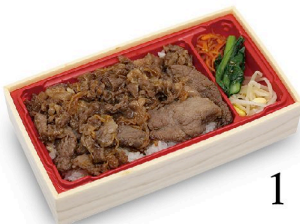
A4黒毛和牛 熟成肉 牛めし重 100g 1,780円 150g 2,280円