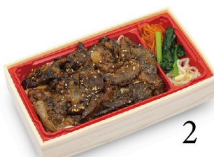
黒毛和牛 熟成肉 スジ焼き重 100g 1,180円 150g 1,480円