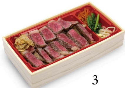
A4黒毛和牛 熟成肉 リブステーキ重 100g 3,180円 150g 4,180円

5つ星お米マイスター竹谷勝良さん厳選のご飯《イクヒカリ》に熟成焼肉を贅沢に敷き詰めた絶品焼肉弁当。肉の量がグラムで選べます